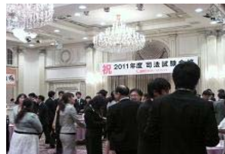
* 昨年の司法試験合格者祝賀・交流会