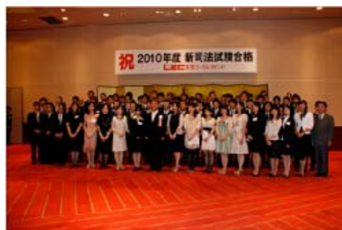
* 昨年(2010年)の新司法試験合格者祝賀・交流会